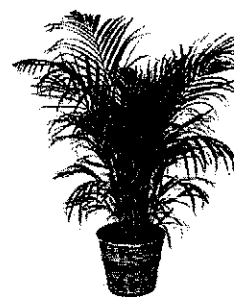
Kenzia o Areca palmata o Chamaedorea elegans

In attesa di ricevere il presente per conferma inviamo cordiali saluti.