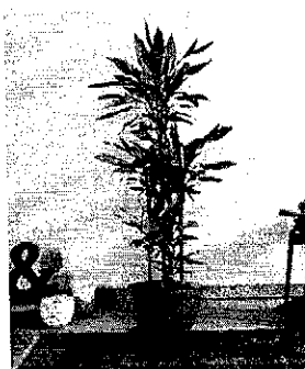
Dracena Janet Craig